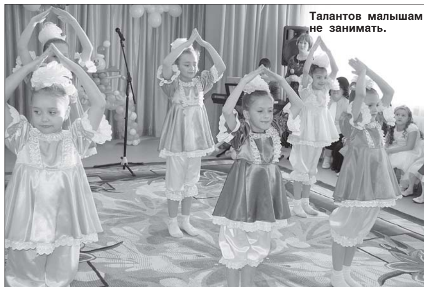
Талантов малышам не занимать.