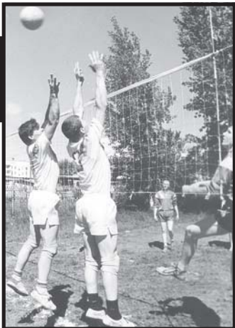
Появление спорткомплекса «Юность» в посёлке Винзили началось с проведения в 2000 году акции по возрождению спорта.