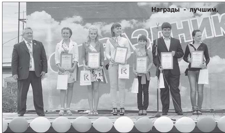
Награды - лучшим.

Неподдельный интерес у присутствующих на празднике вызвали свежие идеи, которые, надеюсь, станут традиционными в проведении подобных мероприятий.