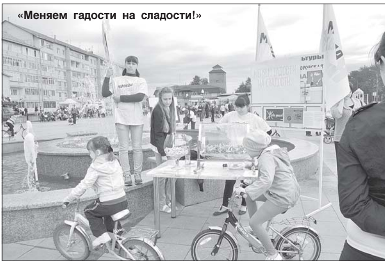
«Меняем гадости на сладости!»

Параллельно проводилась обширная спортивная программа. Все победители конкурсов были награждены призами от спонсоров. Визжала от восторга ребятня, подпрыгивая на батутах. Местные богатыри демонстрирова-