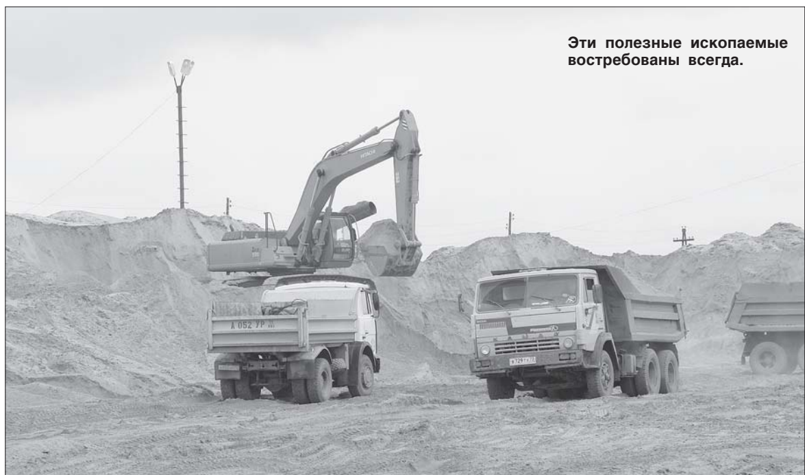
Эти полезные ископаемые востребованы всегда.

Месторождение строительного песка «Озеро Андреевское» - одно из крупнейших в окрестностях Тюмени. Здесь производится крупнозернистый песок. В нашей местности в естественном виде он не встречается. Раньше к нам его возили железнодорожным, автомобильным и водным транспортом из других регионов. Большие расходы на перевозку приводили к тому, что цена крупнозернистого песка в 8-10 раз превышала цены на обычный (мелкий) песок. В 2008 году наше предприятие запустило новую для Тюмени технологию разделения песков на фракции - из мелких песков стали выделять