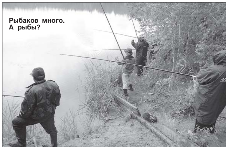
Рыбаков много. А рыбы?

Беседу вёл Владимир ПОРОТНИКОВ.