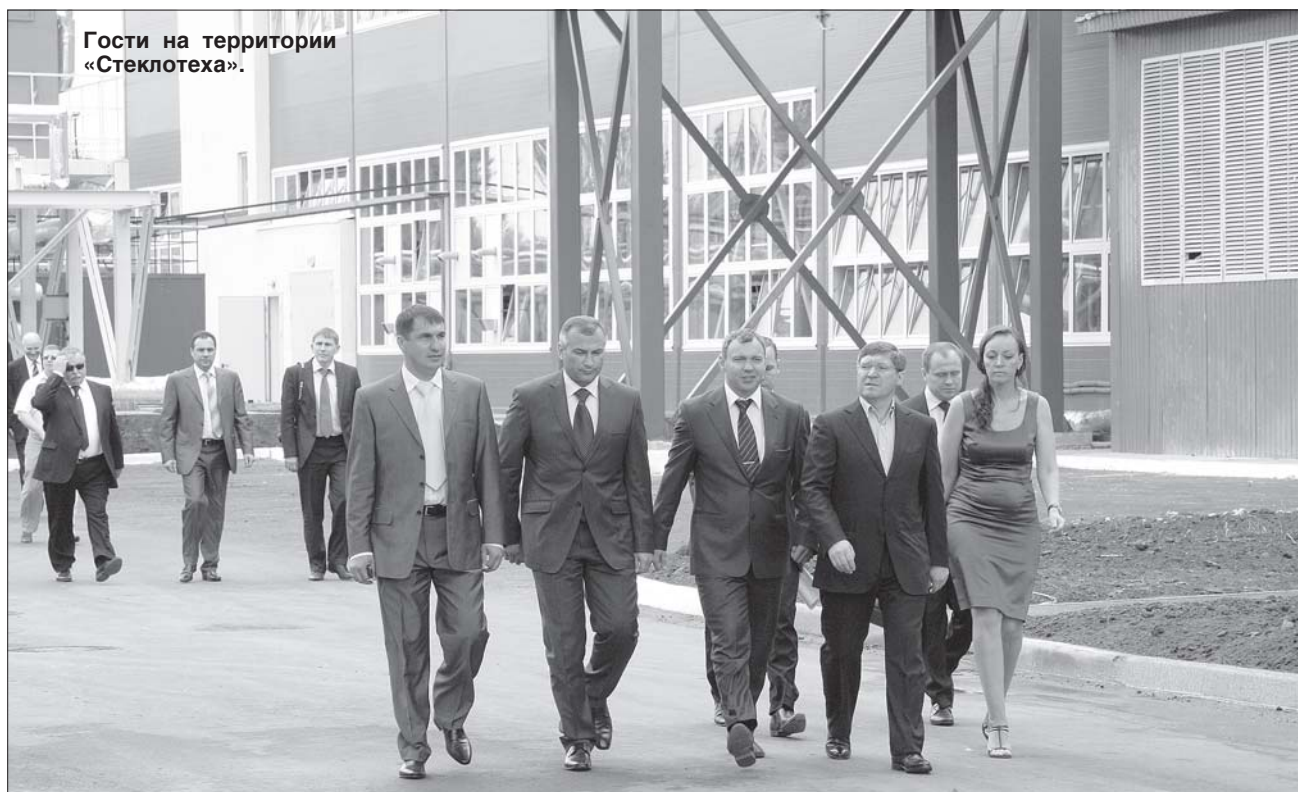
Гости на территории «Стеклотеха».

В Тюменском районе – событие. Подошло время логического завершения одного из крупнейших инвестиционных проектов, реализуемых на территории «столичного», – строительства завода «Стеклотех».