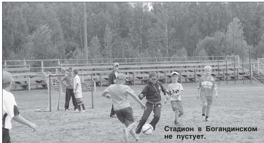
Стадион в Богандинском не пустует.

Губернатор и глава района побывали и на других строительных площадках Богандинки, познакомились с проектом «стеклограда» - посёлка для работников нового завода «Стеклотех». У этого микрорайона будет единый и очень интересный архитектурный облик, здесь планируется