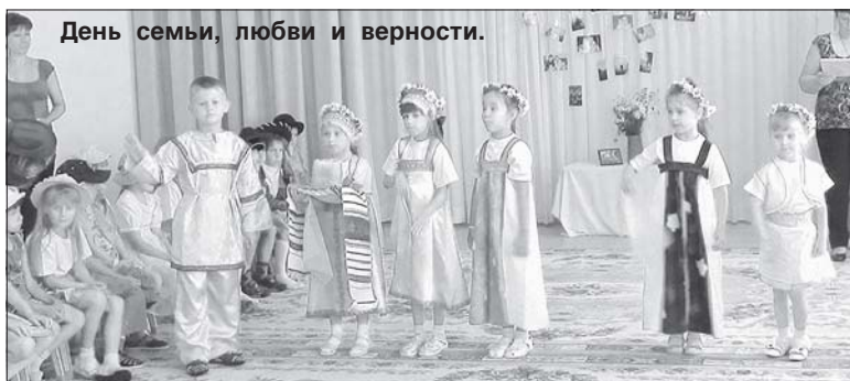
День семьи, любви и верности.

Хочу рассказать о работе клуба бабушек при Богандинском детском садике «Светлячок».